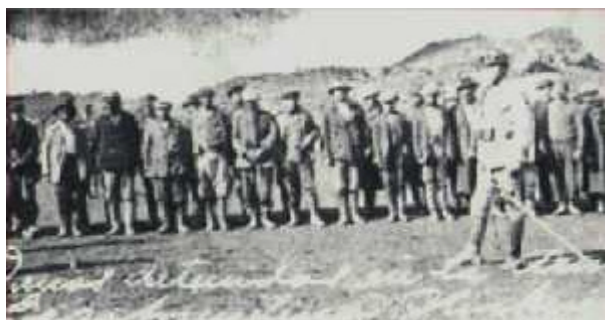
Rendición incondicional de los huelguistas en "La Anita", aquí fue el lugar de mayor número de ejecutados