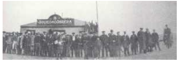
Grupo de personas en la puerta de la Sociedad Obrera de Río Gallegos

El 28 de enero de 1921 en el transporte "Guardia Nacional" se embarcó el 10º Regimiento, al mando del Teniente Coronel Varela, rumbo a Puerto Gallegos. El 29 de enero llegó después de varios meses de estar nombrado el gobernador de la provincia. La llegada del nuevo gobernador Yza permite entrar en una etapa de acercamiento de ambas partes y comienzan las negociaciones. Durante estos días el gobernador Yza pondrá en libertad a los presos sindicales y se suspenderá el clima de represión que se vivía en las ciudades del sur. La actitud dialogante y la promesa de cumplimiento de las reivindicaciones de los trabajadores permitirá el fin de la huelga.