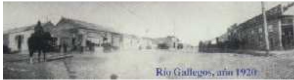
Río Gallegos, año 1920