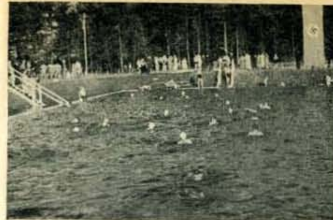
Das „Waldbad an der Osterau“

können Sie in der neu errichteten Freibadeanstalt, dem „Waldbad an der Osterau“ beim alten Kurhaus