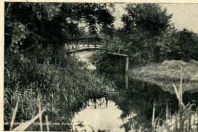
Der alte Kurpark

Werden Sie von Gicht und Rheuma geplagt, so empfehlen wir Ihnen eine Kur in der Rheumaheilstätte